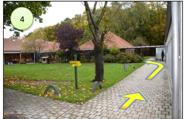
4. geradeaus weiter, dann links abbiegen