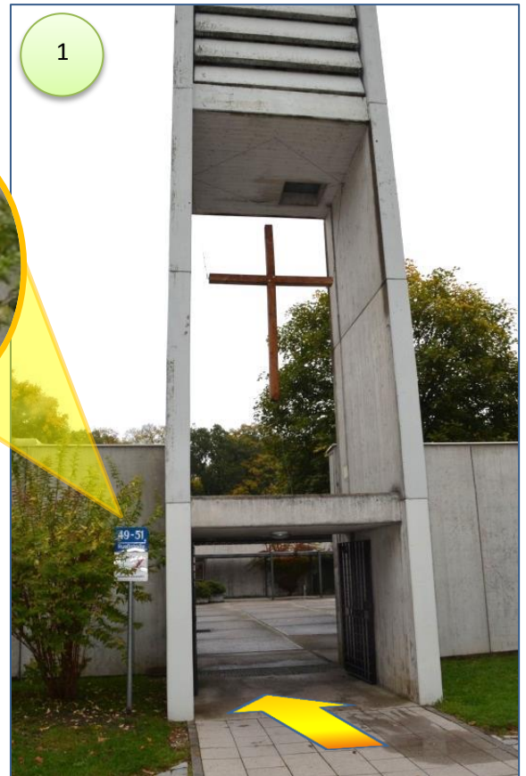
1. durch den Eingang zum Innenhof (Hausnummern-Schild 49-51)