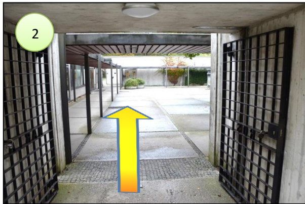
2. geradeaus durch den Innenhof, dann links halten