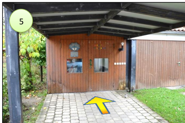
5. die Eingangstüre zu Haus II führt in einen Glasgang