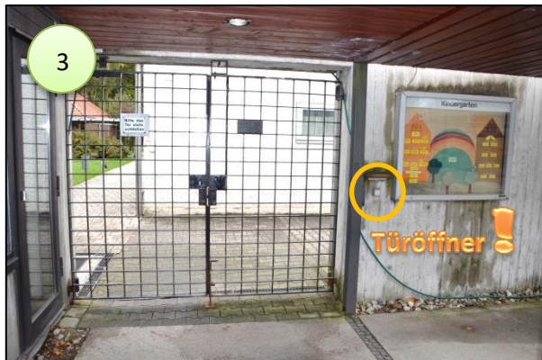
3. zum Öffnen der Eingangstüre den Summer betätigen