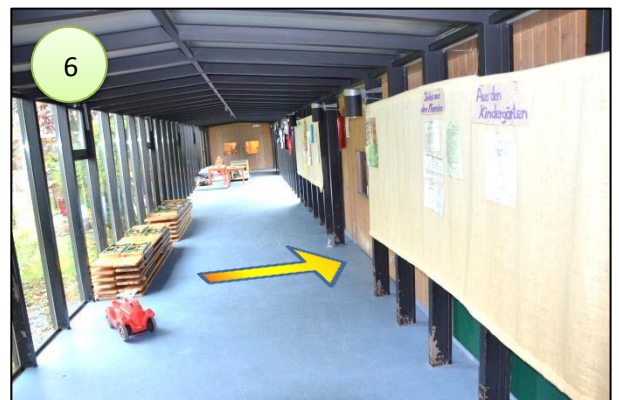
6. dort die erste Türe rechts ist der Eingang zum Sportraum